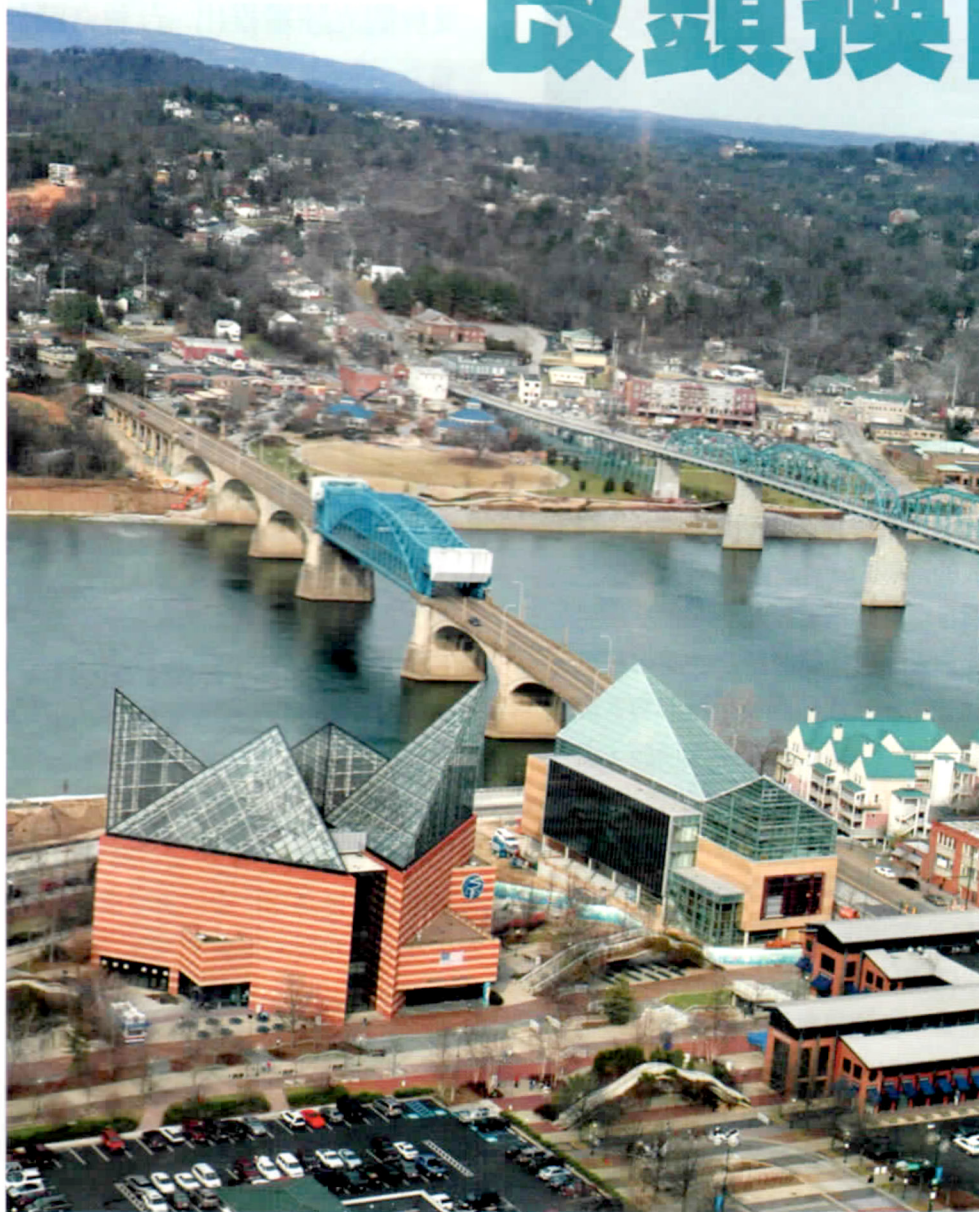
由空中鳥瞰恰特努加的水族館及河濱公園地區。