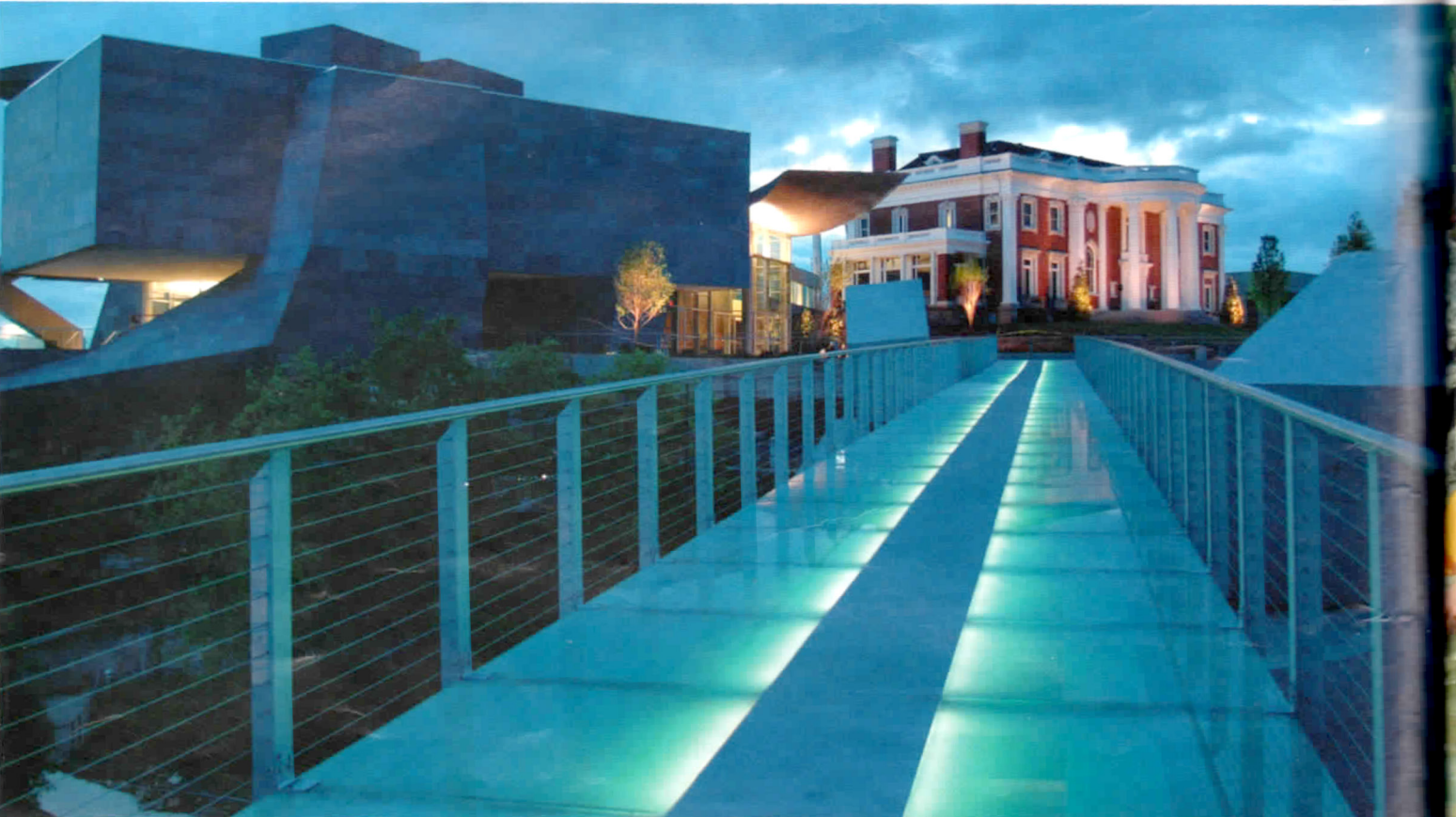
由河濱步道仰望緊鄰河岸的水族館。