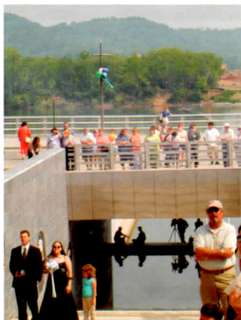
市區通往河濱的「通道」今年5月整建完成，有許多表現原住民切諾奇族人的公共藝術作品。圖中一對新人正步過「通道」。